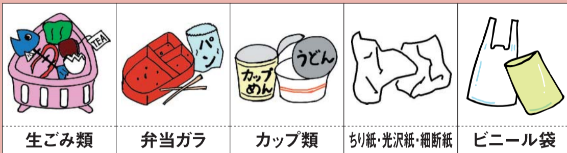
生ごみ類 弁当ガラ カップ類 ちり紙・光沢紙・細断紙 ビニール袋