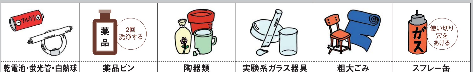
乾電池・蛍光管・白熱球